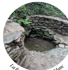
La fontaine du buisson blanc

Situé sur un petit tertre au sommet, cet édifice est dédié à Notre-Dame-de-Bon-Secours. De style néo-gothique, la chapelle est entièrement construite en granit et en pierres du pays extraites de carrières locales. Le Département de la Haute-Vienne a acquis les ruines (1986) puis les a cristallisées en 1992. L'énorme cloche en bronze a été restaurée et réinstallée en 2010, avec le concours de l'association des Amis du Mont Gargan.