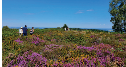
La lande sèche