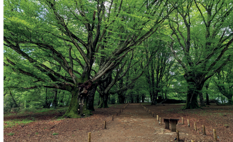
L'allée de hêtres centenaires

Culminant à 731 mètres d'altitude, il est possible d'observer, de son sommet, un panorama exceptionnel sur le plateau de Millevaches, le massif des Monédières et l'ensemble des plateaux limousins jusqu'aux Monts d'Auvergne.