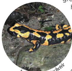
La salamandre tachetée

La salamandre tachetée se reproduit chaque année sur le site, au creux de la fontaine du buisson blanc.