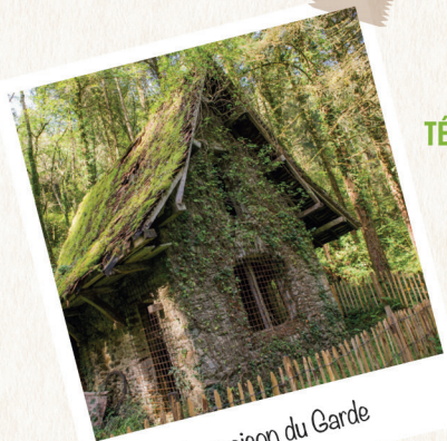
La maison du Garde