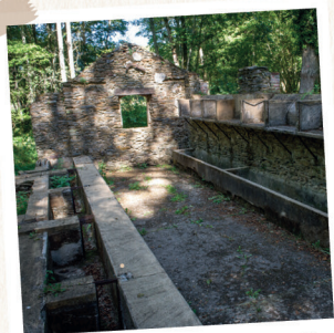
La Pisciculture de Frédéric Le Play