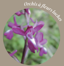
Orchis à fleurs lâches