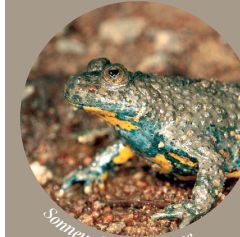
Sonneur à ventre jaune