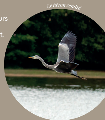
Le héron cendré

L'étang et ses abords offrent un spectacle apprécié des amateurs d'ornithologie. Un observatoire, accessible toute l'année, permet, sans les déranger d'observer de nombreux oiseaux présents sur l'étang selon les saisons : héron cendré, chevalier guignette, grande aigrette, grèbe huppé, sarcelle d'hiver, foulque macroule, martin pêcheur, etc.