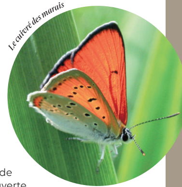
Le cultivé des marais

Depuis la mise en service en 2020 de la passerelle enjambant le Gorret, le sentier pédestre « Tour de l'étang de La Pouge » d'une distance de six kilomètres est inscrit au Plan Départemental des Itinéraires de Promenade et de Randonnée (PDIPR). Il permet de découvrir le site. Sentier de découverte, observatoire ornithologique, village de la Pouge, petit patrimoine bâti (deux anciens pavillons de chasse construits au XIX e siècle sur chaque rive, un le long de la D58 et l'autre au village de Leycuras) ou encore de nombreux points de vue sur l'étang sont au programme !