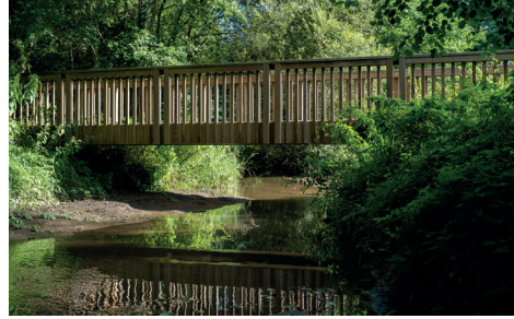
La passerelle sur le Gorret