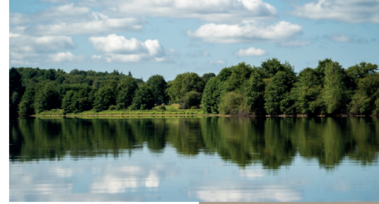
Les rives de l'étang

Les espaces naturels sensibles EN HAUTE-VIENNE